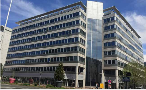
Panoramic, Lyon (69)