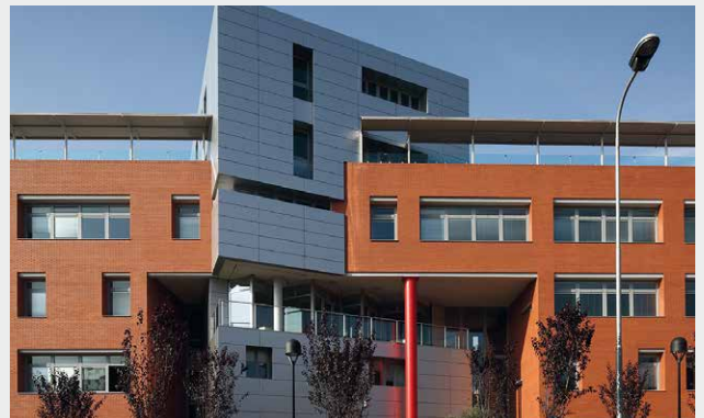
École Internationale, Milan