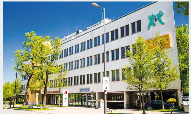
Maison Médicale Pasing, Munich