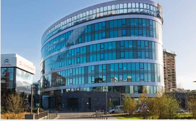
L'Ovalie, Paris (75)