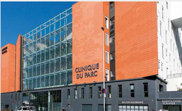
Clinique du Parc, Lyon (69)