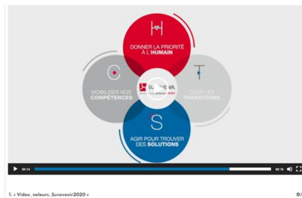
Figure 9 - Pertes d'informations hors css

Critère 10.3 Dans chaque page web, l'information reste-t-elle compréhensible lorsque les feuilles de styles sont désactivées ?