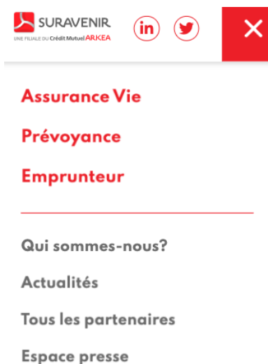
Figure 8 - Exemple d'accordéon non conforme

Critère 7.2 Pour chaque script ayant une alternative, cette alternative est-elle pertinente ?