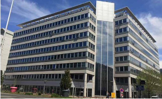
Panoramic, Lyon (69)