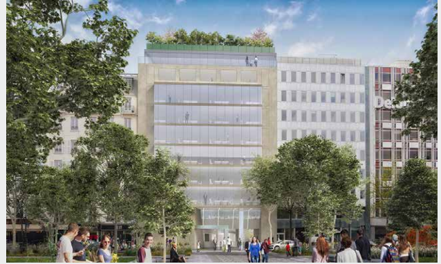
Le 179, Neuilly-sur-Seine (92)