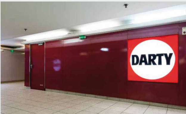
Darty La Madeleine, Paris (75)