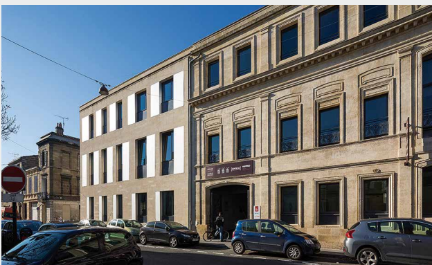
École Iseg, Bordeaux (33)