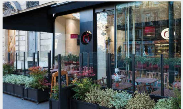
Commerces parisiens, Paris (75)