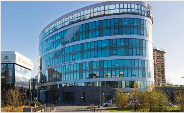
L'Ovalie, Paris (75)