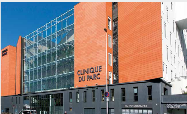
Clinique du Parc, Lyon (69)