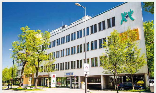
Maison Médicale Pasing, Munich